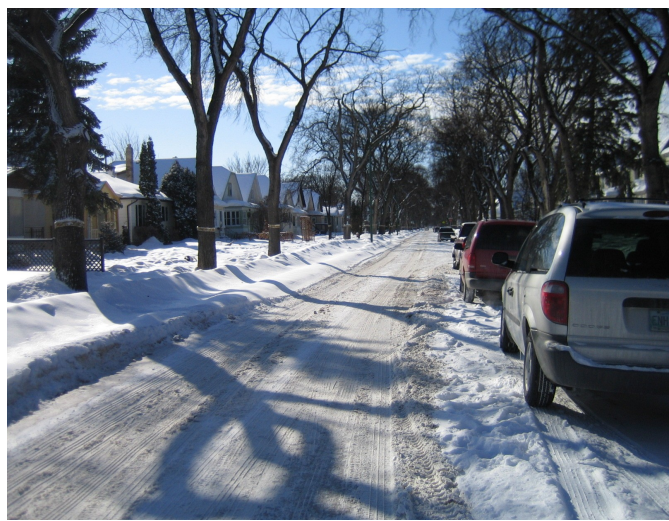
Typische Wohngegend in Winnipeg

Winnipeg ist eine Stadt mit ca. 700000 Einwohnern, doch man fühlt sich nicht wie in einer Grossstadt. Die Stadt ist im Blocksystem aufgebaut und innerhalb von 2 Wochen kennt man die wichtigsten Lokalitäten. Zur Orientierung ist anfangs ein Blick in den Stadtplan sehr hilfreich. Die Stadt besitzt keine große Industrie. Es gibt viel Gastronomie und Einzelhandel, und kleinere Betriebe aller Art.