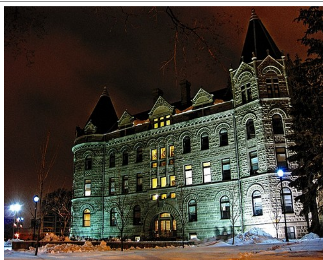
UW Hauptgebäude "Wesley Hall" bei Nacht

Im Winter wird es dort auch richtig kalt. Die Tiefstwerte in Jan und Feb liegen um -40^{\circ} C. Im Durchschnitt bei -25^{\circ} C.. Dennoch muss ich sagen, das es sich schlimmer anhört als es tatsächlich war, wenn auch Aufenthalte im Freien weitestgehend kurz gehalten wurden, und dies auch nur gut verpackt in Winteranorak, Schaal und Handschuhen. Nichts desto trotz, das Leben dort läuft wie in jeder anderen Stadt und schön sind vor allem die 90% Sonnentage. Ab Ende März, Anfang April gingen die Temperaturen dann schon in den positiven Terrain über.