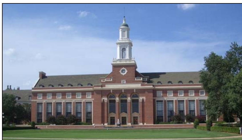
Bibliothek der OSU

Obleich die OSU eine sehr große Universität ist, setzt ihre Größe nicht die persönliche Aufmerksamkeit herab, die jedem Kursteilnehmer gegeben wird. Die durchschnittliche Zahl von Kursteilnehmern ist kleiner als 150, d.h. im Vergleich zur Fachhochschule Bingen ein deutlicher Unterschied. Die Größe der Universität hat viele eindeutige Vorteile. So umfasst die Bibliothek 2 Millionen Exemplare die von den Studenten kostenfrei ausgeliehen werden können.