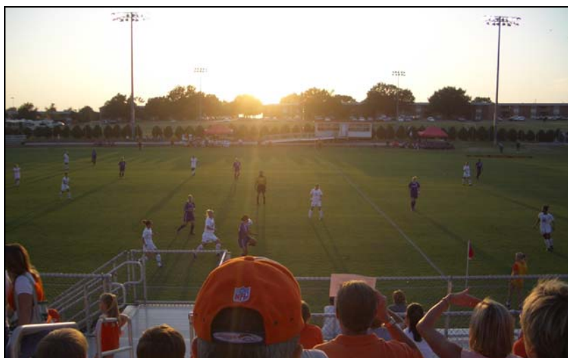
Soccer an der OSU

Raufende, für mich zum Teil fette Kerle schlagen sich um einen Ball, der noch nicht einmal rund ist. Und das Tor hat kein Netz – das soll Football sein? Dass was hier Tausende in die Stadien lockt heißt in den USA „Soccer“ und ist in erster Linie Frauensport. Männer spielen lieber American Football.