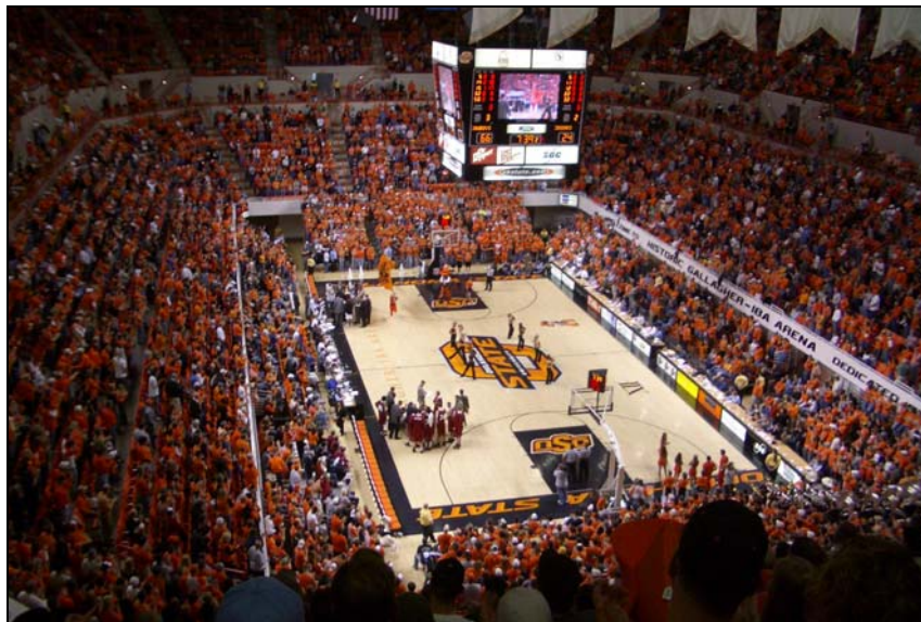
Basketball an der OSU

Im Amateurbereich unterscheidet man zwischen Freizeit- und Wettkampfsport. Zu den bevorzugten Erholungsaktivitäten zählen Wandern und Spazieren – speziell bei den älteren Menschen, Boot fahren, Jagen und Angeln. Dabei setzen die Amerikaner ganz bewusst auf die Kombination von Erholung und Aktivität.