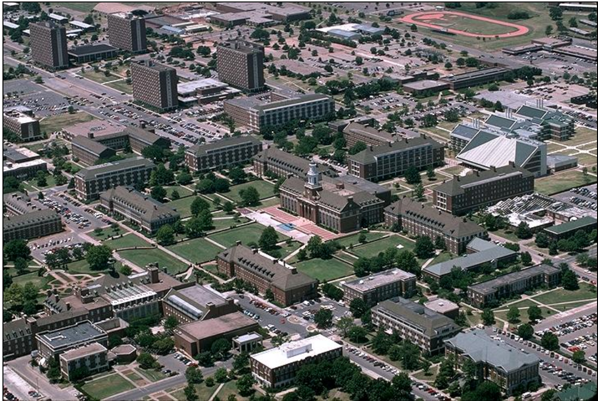
Vogelperspektive vom OSU-Campus

Die Oklahoma State University (OSU) befindet sich ca. 60 Meilen nordöstlich von Oklahoma City in der relativ kleinen Stadt namens Stillwater, mit einer Bevölkerungszahl von mehr als 42.000 Menschen. Die OSU wurde am 25. Dezember 1890 als landwirtschaftliche und mechanische Hochschule Oklahomas, gerade zwanzig Monate nachdem der Landdurchlauf von 1889, gegründet. Als die ersten Studenten am 14. Dezember 1891 in Stillwater eintrafen um zu studieren, gab es noch keine Gebäude, keine Bücher und keinen Lehrplan. Im Jahre 1894, zweieinhalb Jahre nachdem die ersten lokale Kirchen errichtet wurden, zogen 144 Studenten in das erste akademische Gebäude, später bekannt als Old Central, auf der südöstlichen Ecke vom heutigen Campus.