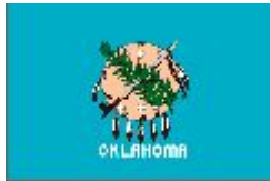
Flagge von Oklahoma

Oklahoma (OK) ist ein US-Bundesstaat im zentralen Süden der USA, nördlich von Texas. Das Wort Oklahoma stammt aus der Choctaw-Sprache: „okla“, der Mensch und „humma“, rot. Die Hauptstadt Oklahomas ist Oklahoma City. Oklahoma umfasst ein Gebiet von 181.186 km 2 , in dem ca. 3,35 Mio. Menschen leben.