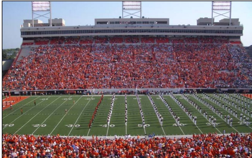
American Football an der OSU

Mein erster Eindruck von USA war, was wären die Amerikaner ohne ihren Sport? Egal ob Baseball, Basketball oder American Football – um nur die beliebtesten Sportarten zu nennen – besitzt der Sport einen sehr hohen Stellenwert in der amerikanischen Gesellschaft. Er füllt die Rolle der beliebtesten Freizeitgestaltung aus, ob passiv oder aktiv.