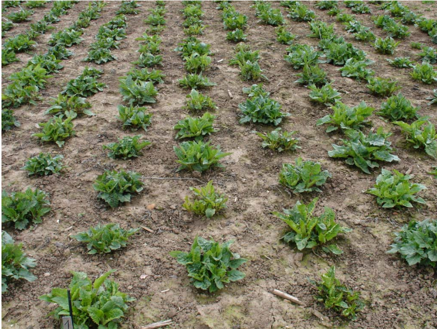
Abb. 1: Silphiumbestand am 15.04.2008 in Bingen (Herkunft 1)

Sicher müssen weitere Erfahrungen mit dieser Pflanze gesammelt werden, aber es zeigten sich bereits einige Schwierigkeiten, die zunächst näher betrachtet und untersucht werden sollten, bevor der Anbau von Silphium in der landwirtschaftlichen Praxis empfohlen werden kann.